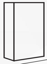
Saco de 44 Lbs