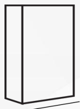
Saco de 44 Lbs